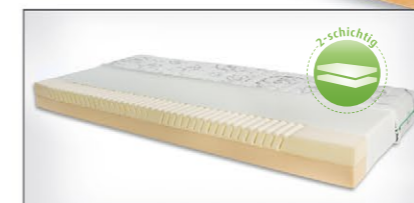
Vitalia mit erhöhtem Kaltschaum und Zonensystem