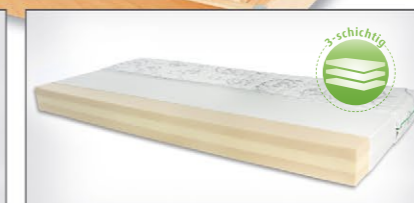
Triversa mit 3-schichtigem Polyether-Schaum