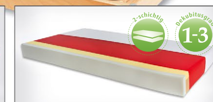
Visco-Anti-Dekubitusmatratze mit Sitzkante